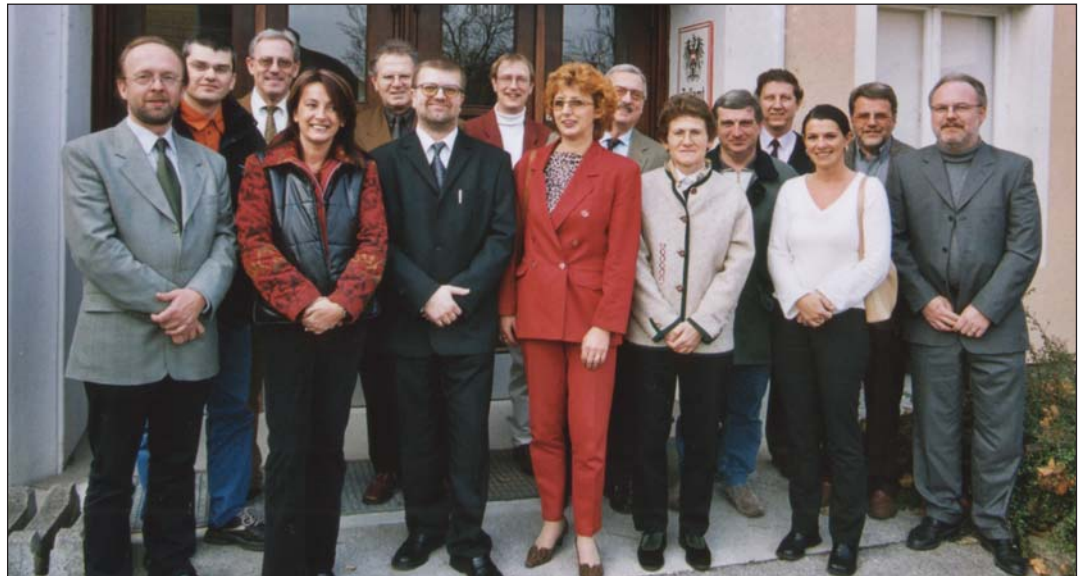
Runder Tisch beim Zollamt St. Pölten am 6. November 2002

Die jetzige Erweiterung bietet die Chance, den Kontinent wieder zu vereinigen. Die Europäische Union nimmt Länder mit unterschiedlichsten Ausgangsvoraussetzungen auf: Kleine Mittelmeerinseln, ehemalige sowjetische Satellitenstaaten - sogar ehemalige Sowjetrepubliken.