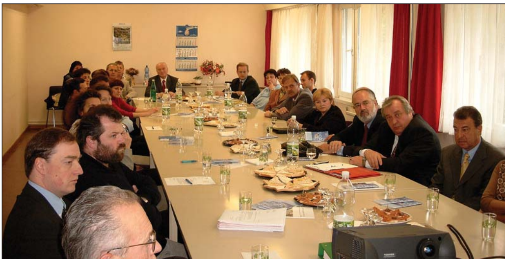
Auch beim Zollamt Tulln folgten viele Kunden der Einladung zum “Runden Tisch” am 14. Oktober 2002.

Dies alles geschieht vor dem Hintergrund einer schnellen Weiterentwicklung der Politik und der Verfahren der EU selbst. Da mit der Integration das Konfliktpotential sinkt, bietet sich allen europäischen Bürgern die Aussicht auf die Festigung der politischen Stabilität, welche zu allen Zeiten Grundlage für den Wohlstand ist. Die Öffnung zieht aber auch Probleme für die Zollverwaltung und durch die Steigerung des Wettbewerbs für die Wirtschaft nach sich. Die Probleme gilt es in der verbleibenden Zeit intensiv gemeinsam zu diskutieren und Lösungsansätze zum Wohle aller zu entwickeln.