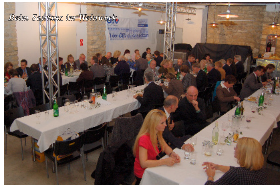
Beim Sautanz im Weinwerk

Das Hotel Wende, das als Unterkunft für viele Mitglieder und deren Angehörige diente, bot am Samstag vormittag den bestens geeigneten Veranstaltungsrahmen für das Seminar. Unser