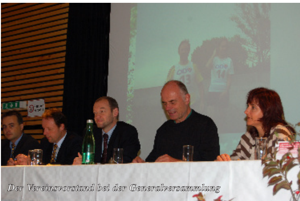
Der Vereinsvorstand bei der Generalversammlung

Danach gab es im angrenzenden Kulturstadl einen original burgenländischen Sautanz. Das köstliche Buffet ließ trotz kalt-regnerischem Wetter gute Laune aufkommen. Diese wurde durch eine